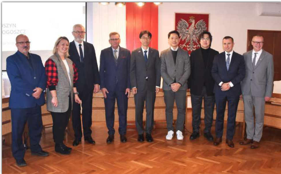
Wspólne zdjęcie uczestników spotkania

20 października br. w Urzędzie Miejskim w Barcinie gościli przedstawiciele południowokoreańskiej firmy „Hanwha Aerospace”, którzy są zainteresowani ulokowaniem inwestycji w Gminie Barcin.