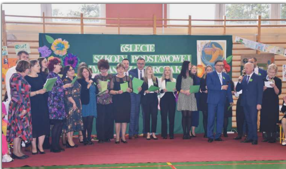
Niespodzianką dla zgromadzonych był występ nauczycieli i pracowników szkoły, którzy odśpiewali napisaną przez siebie pieśń „Jubilatkę”