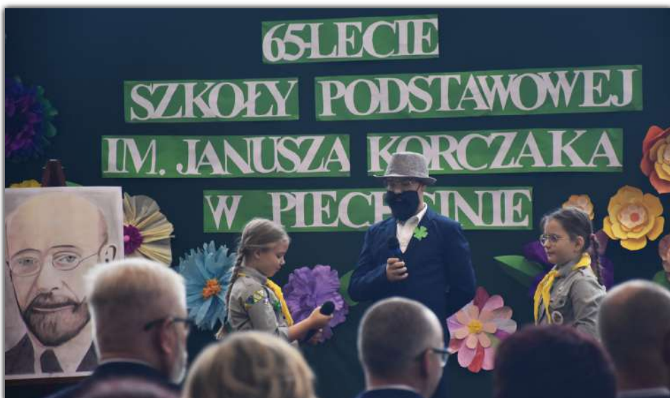
Główną częścią rocznicowych obchodów była uroczysta akademie w wykonaniu harcerzy, zuchów, uczniów placówki

Niech jubileusz 65-lecia będzie okazją do dumy z dotychczasowych osiągnięć, ale i inspiracją do dalszej twórczej pracy dla dobra kolejnych pokoleń. Życzymy, aby szkoła nadal była miejscem przyjaznym, bezpiecznym i pełnym pasji, gdzie rozkwita wiedza, talenty i przyjaźnie”.