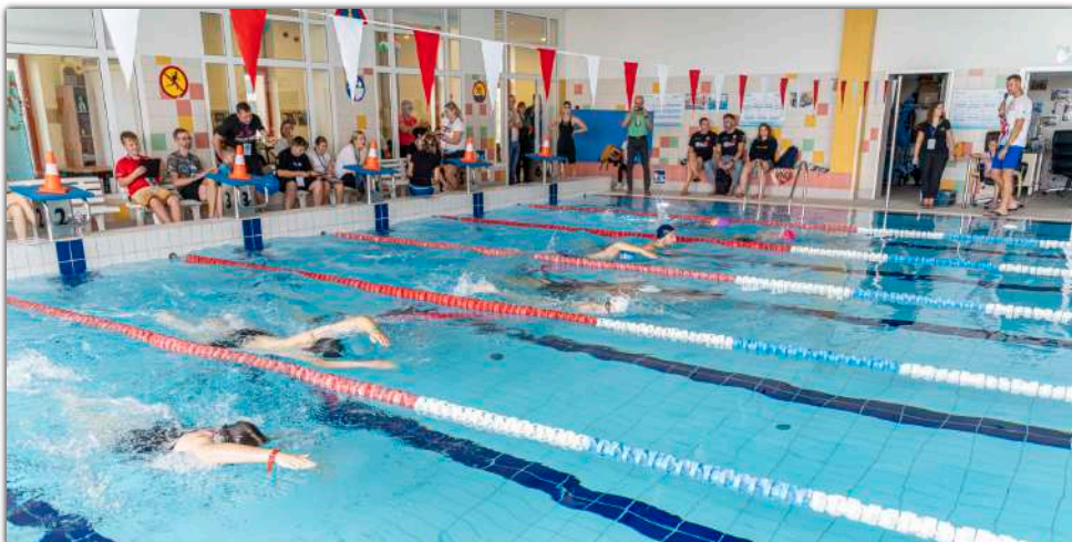
W zawodach „Ratowniczy Kilometr” wystartowała młodzież i dorośli

Umowę na budowę krytej pływalni podpisano 14 października 2009 roku, rozpoczynając tym samym ważny etap w rozwoju infrastruktury sportowo-rekreacyjnej gminy. Już kilka dni później, 19 października 2009 roku, miało miejsce symboliczne wbicie pierwszej łopaty na placu budowy. Po roku intensywnych prac, 19 października 2010 roku, podpisano umowę pomiędzy Urzędem Miejskim w Barcinie a Spółką Barciński Ośrodek Sportu i Rekreacji, która przejęła zarządzanie nowo wybudowanym obiektem.