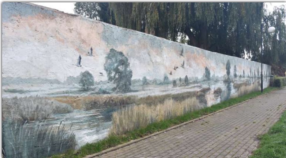
Mural powstał w ramach projektu „Kolorowe skrzydła mocy”

□ Na zewnętrznej ścianie ogrodzenia Środowiskowego Domu Samopomocy w Barcinie pojawił się wielkoformatowy malunek. Powstał on w ramach programu „Kolorowe skrzydła mocy”, który aktualnie realizuje placówka.