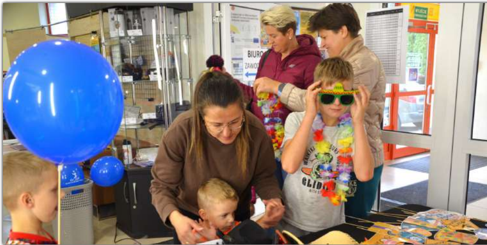
Dodatkową atrakcją wydarzenia była fotobudka „360”. Do zdjęć można było pozować w zabawnych przebraniach