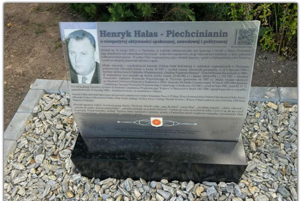
Tablica zawierająca życiorys patrona Parku 100-lecia w Piechcinie znajduje się w pobliżu wejścia na teren kompleksu

„Pójdiesz, Henryku, do roboty. Pomożesz mnie i matce. W laboratorium, u inż. Karaima, potrzebny jest goniec.”