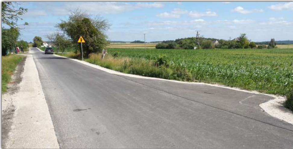
Wykonane inwestycje usprawniły komunikację między różnymi częściami sołectwa Młodocin

□ Mieszkańcy sołectwa Młodocin mogą cieszyć się z wykonanych inwestycji drogowych, które z pewnością przyczyniły się do poprawy bezpieczeństwa i zapewniły mieszkańcom komfort dojazdu do swoich posesji.