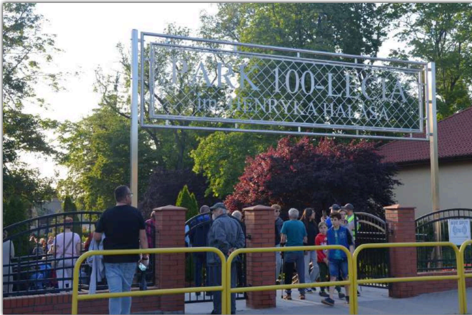
Przed wejściem do parku widoczna jest również tablica, z nową nazwą „Park 100-lecia im. Henryka Hałasa”

Nie takie miał ambicje. Taka była potrzeba, to był przejaw troski o rodzinę.