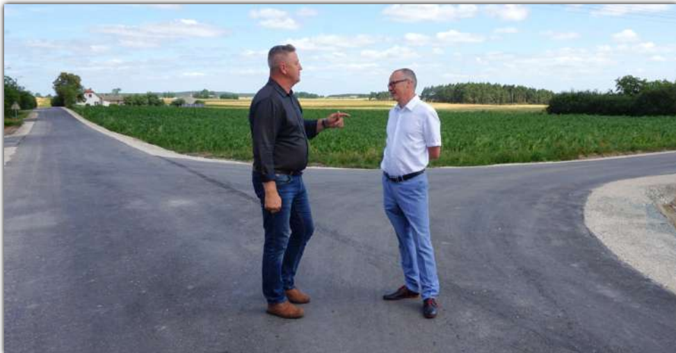
Zmodernizowano ponadto drogę wewnętrzną od drogi wojewódzkiej nr 251 i w bok w kierunku drogi powiatowej Obielewo - Młodocin - Kierzkowo