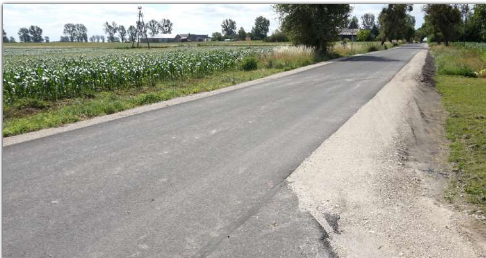
Inwestycje drogowe w sołectwie Młodocin wpłynęły też niewątpliwie na bezpieczeństwo

W ciągu ostatniego roku na terenie sołectwa wykonano inwestycje, które ułatwiły komunikację między Młodocinem dolnym, górnym, pałacem i świetlicą. Wykonano: modernizację drogi gminnej Młodocin - Jadowniki Bielskie na odcinku od drogi wojewódzkiej nr 251 w kierunku pałacu i dalej do drogi powiatowej o długości 0, 629 km (całkowita wartość inwestycji 659 tys. 880, 93 zł), modernizację drogi gminnej Murczyn - Młodocin, czyli łącznika drogi wojewódzkiej nr 251 i drogi powiatowej Młodocin - Jadowniki o długości 1, 112 km (869 tys. 717, 23 zł). Obie inwestycje zostały dofinansowane z Rządowego Funduszu Rozwoju Dróg – pierwsza w kwocie 387 tys. 69, 96 zł, druga w wysokości 508 tys. 675, 94 zł.