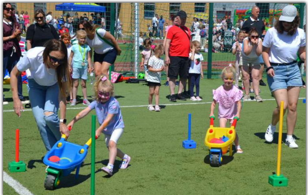
Na przebiegu wszystkich zaplanowanych konkurencji sportowych czuwały niezawodnie panie przedszkolanki

Środki finansowe, z których zorganizowano przedsięwzięcie pochodziły z budżetu gminy w ramach realizacji Gminnego Programu Profilaktyki Rozwiązywania Problemów Alkoholowych oraz Przeciwdziałania Narkomanii w Gminie Barcin na rok 2025.