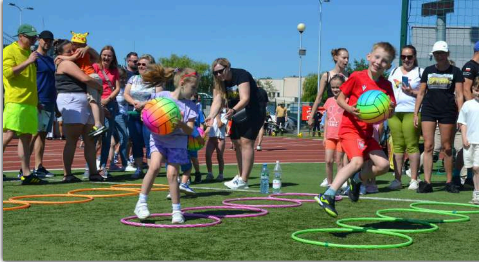
Jak widać udział w sportowym przedsięwzięciu dostarczył dzieciom dużo radości

□ Po raz czwarty zaprosiliśmy dzieci i ich opiekunów do wzięcia udziału w Olimpiadzie Przedszkolaka. Impreza odbyła się 14 czerwca na barcińskim stadionie. Przedsięwzięcie ma na celu propagowanie zdrowego stylu życia poprzez rozwijanie sprawności fizycznej, budowanie odporności psychicznej przy zachowaniu zasad zdrowej konkurencji sportowej, a także spędzanie czasu wspólnie z rodzicami i dziadkami.