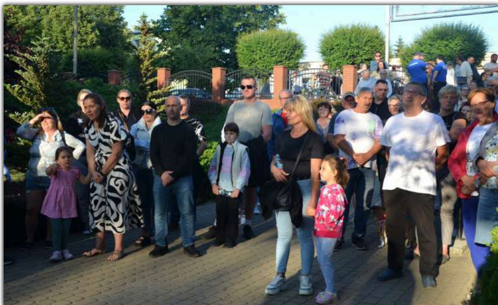
W uroczystości odsłonięcia tablicy uczestniczyli mieszkańcy gminy Barcin