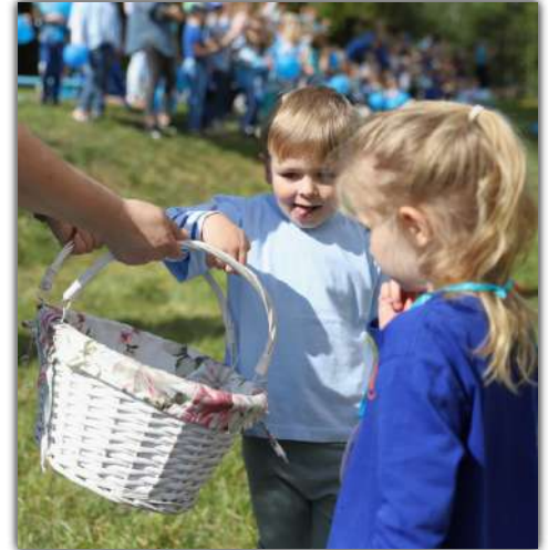
Za pokonanie toru przeszkód dzieci otrzymały medal i cukierka

Podczas wydarzenia dzieci uczestniczyły w sportowych konkurencjach