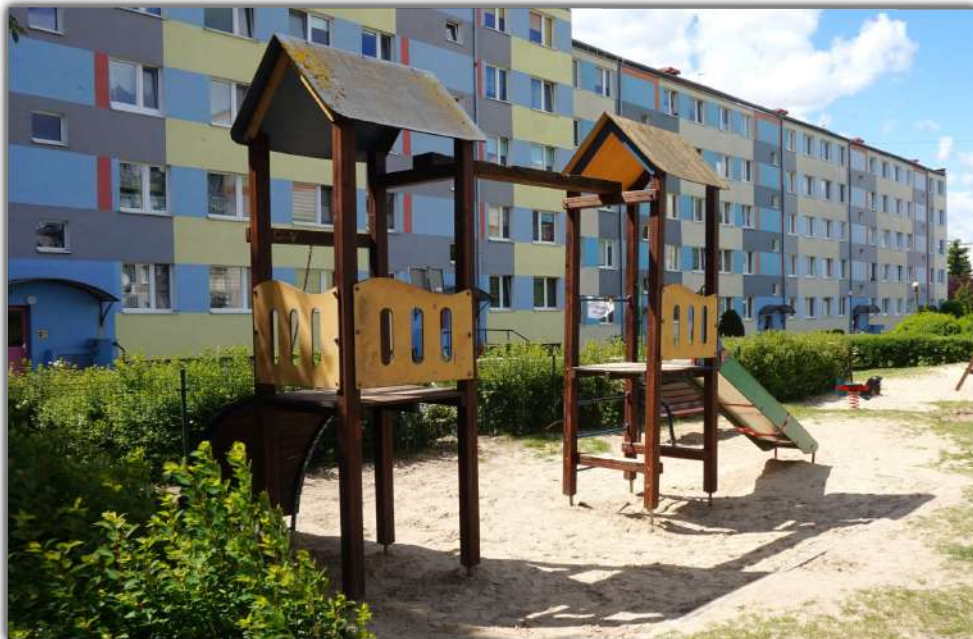
Plac zabaw przy ulicy Artylerzystów w Barcinie, usytuowany jest na działce drogowej