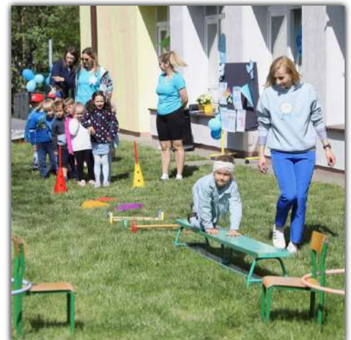
Nad sprawnym przebiegiem zawodów czuwały panie przedszkolanki