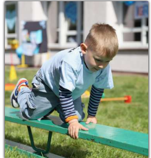
Maluchy chętnie zaangażowały się w pokonanie toru przeszkód

Dzieci uczestniczyły w konkurencjach ruchowych, promujących zdrowy styl życia i współpracę.