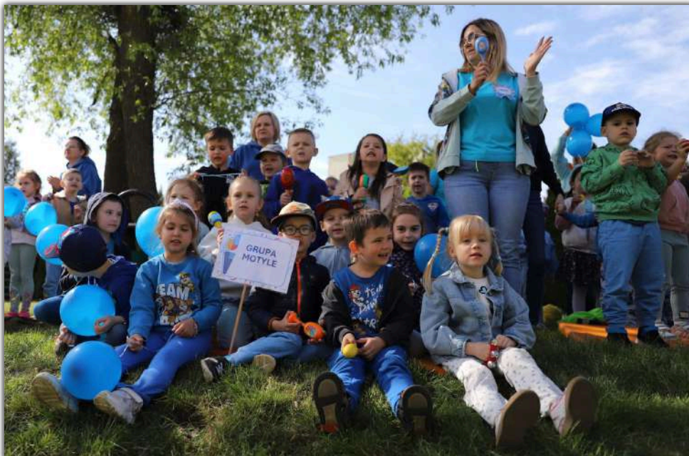
Niebieskie Igrzyska zgromadziły całą społeczność placówki