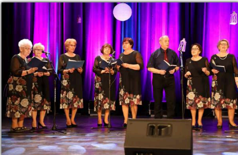
Aby poczuć „Trochę miłości w środku zimy” Rada Słuchaczy UTW, 20 lutego zorganizowała przegląd zespołów wokalnych. Wystąpiły zespoły z: Mogilna, Strzelna, Szczepanowa, Pakości i Barcina