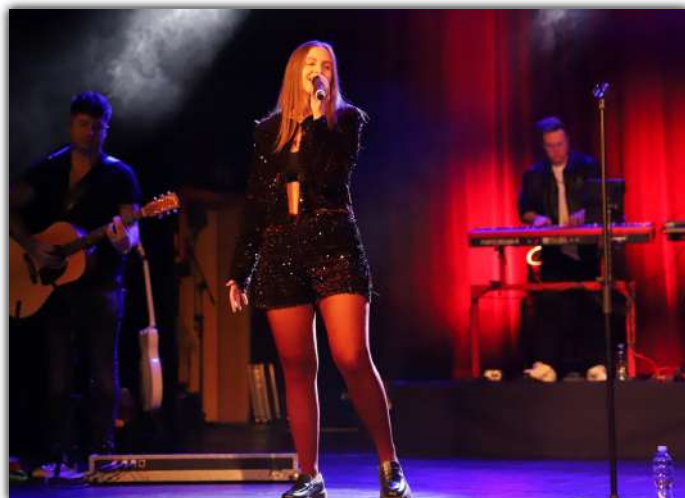
Luty i marzec upłynął w MDK w Barcinie pod znakiem muzyki. Z okazji Dnia Kobiet zorganizowano koncert „Ty się śmiejesz, Madame”