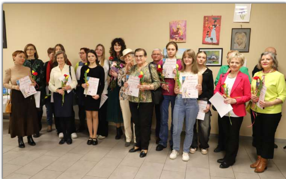
Uczestnicy zajęć artystycznych w Miejskim Domu Kultury w Barcinie