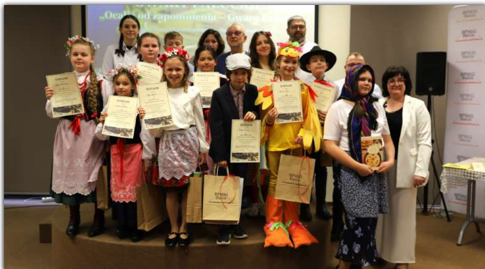
Laureaci tegorocznej, szesnastej edycji Powiatowego Konkursu Gwary Pałuckiej. Kolejna edycja wydarzenia za dwa lata

Uczestnicy konkursu reprezentowali następujące placówki: SP nr 1 w Barcinie, Zespół Szkół w Barcinie, Niepubliczną Szkołę Podstawową z Brzyskorzostwi, SP w Gąsawie, SP w Janowcu Wielkopolskim, SP w Januszkowie, Niepubliczną Szkołę Podstawową w Laskowie, Zespół Szkół w Lubostroniu, Zespół Szkół w Łabiszynie, SP w Mamiczynie, SP w Piechcinie, SP w Rogowie, SP w Świątkowie, SP w Żernikach, SP nr 2 i SP nr 5 w Żninie.