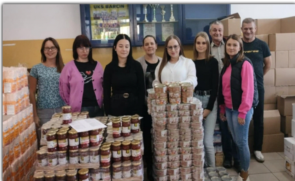
Każdorazowo przy wyładunku kolejnej partii żywności pomagają niezawodni wolontariusze

Od 22 lat Pomorsko – Kujawsko Zrzeszenie Samopomocy Obywatelskiej „Sampo” w Barcinie realizuje projekt „Żywność w darze”. Z tej formy wsparcia skorzystało już kilka tysięcy osób. W 2024 roku do rąk 519 potrzebujących mieszkańców gminy Barcin, w pięciu transportach trafiło 28 tys. 176, 47 kg żywności za łączną kwotę 191 tys. 889, 54 zł.