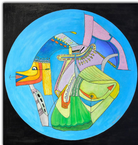
Kodrysy - Przejście przez portal