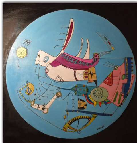
Pokaz kodryсів stworzony w 2015 roku

Barcinianka wystawiała też w księgarniach w Barcinie i Inowrocławiu. Otrzymała ponadto nagrodę „Centura” dla najlepszego artysty 2013 r.