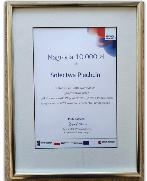
Nagrodą dla sołectwa Piechcin jest 10 000 zł

- Ta nagroda to piękne potwierdzenie naszej lokalnej, dobrej współpracy, to pokazuje, że razem możemy wszystko. Kiedy zostałam sołtyską w 2019 roku zależało mi na