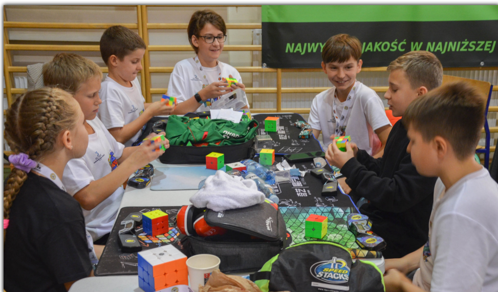
W zawodach uczestniczyli także miłośnicy kostki Rubika z Zespołu Szkół w Barcinie

□ To była pierwsza taka impreza w naszej gminie i jedna z nielicznych w województwie kujawsko - pomorskim. W Zespole Szkół w Barcinie, przez dwa dni (26 i 27 października), 94 speedcuberów z całej Polski i w różnym wieku uczestniczyło w zawodach, w których mogli sprawdzić swoje szybkościowe umiejętności.