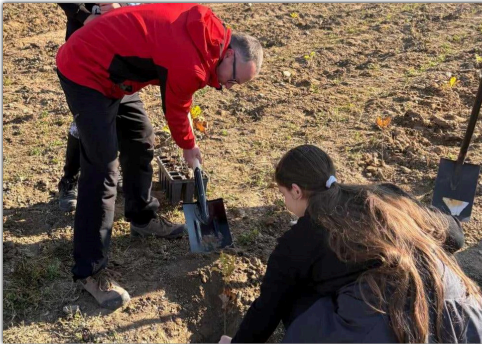
Przedsięwzięcie ma na celu rekultywację terenu, gdzie kiedyś funkcjonowały żwirownie

□ Przedstawiciele instytucji działających na terenie gminy Barcin wzięli udział w wielkiej akcji sadzenia drzew liściastych na granicy Zalesia Barcińskiego i Wojdala w gminie Pakość. Inicjatywa została przygotowana przez Nadleśnictwo Gołębki.