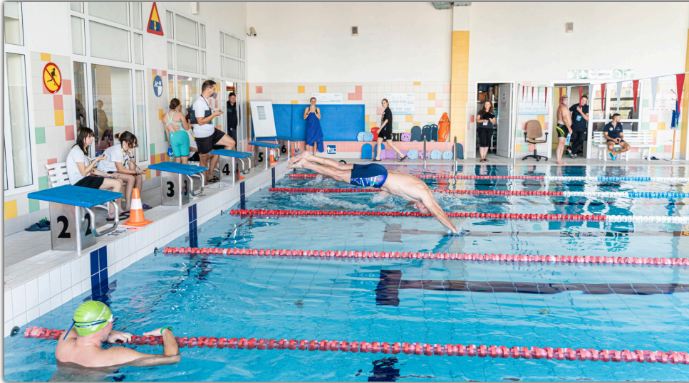
W zawodach wystartowali zawodnicy i zawodniczki w różnym wieku

□ Sporo się działo i działać będzie w Barcińskim Ośrodku Sportu i Rekreacji. Za nami zawody Ratowniczy Kilometr i impreza „Hola Mexico”. W planach m.in. pierwsze w historii zawody Aquathlon indor, zawody mikołajkowe i spotkanie z saunamistrzem. Zapraszamy!