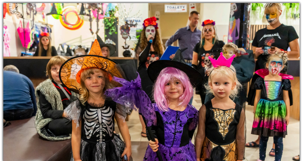
Impreza „Hola Mexico” przyniosła dużo radości szczególnie młodym mieszkańcom gminy

Długie jesienno-zimowe wieczory są świetną okazją do skorzystania z dobrodziejstw strefy saun na barcińskiej pływalni. 13 grudnia zapraszamy na wieczór saunowy w godz. od 21.15 do 23.15. W tym czasie obowiązuje saunowanie nietekstylne. 20 grudnia z kolei wyjątkowe saunowanie z saunamistrzem. Start o godz. 21.30, zakończenie pół godziny po północy. Będą to trzy relaksujące seanse w saunie fińskiej, sesja z peelingami w łaźni parowej, aromaterapia i niezapomniany koncert z gongami na zakończenie.