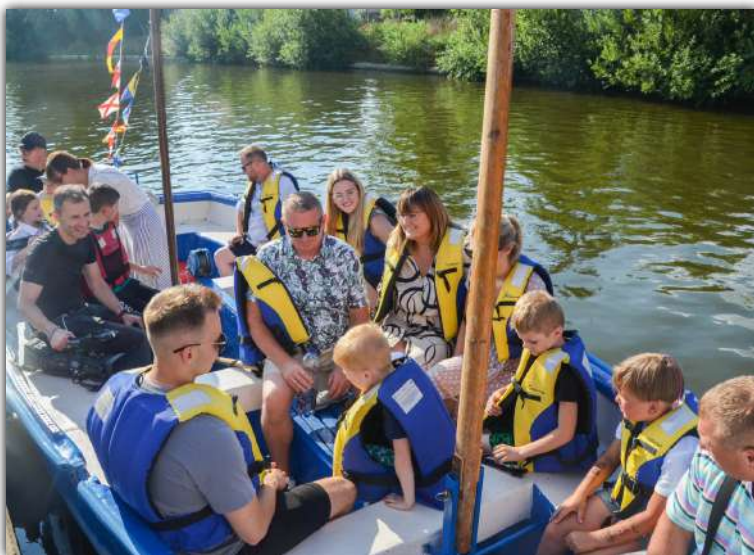
Wodne spaceru po Noteci zafundował jak zwykle Klub Żeglarski „Neptun”, a te cieszyły się sporą popularnością