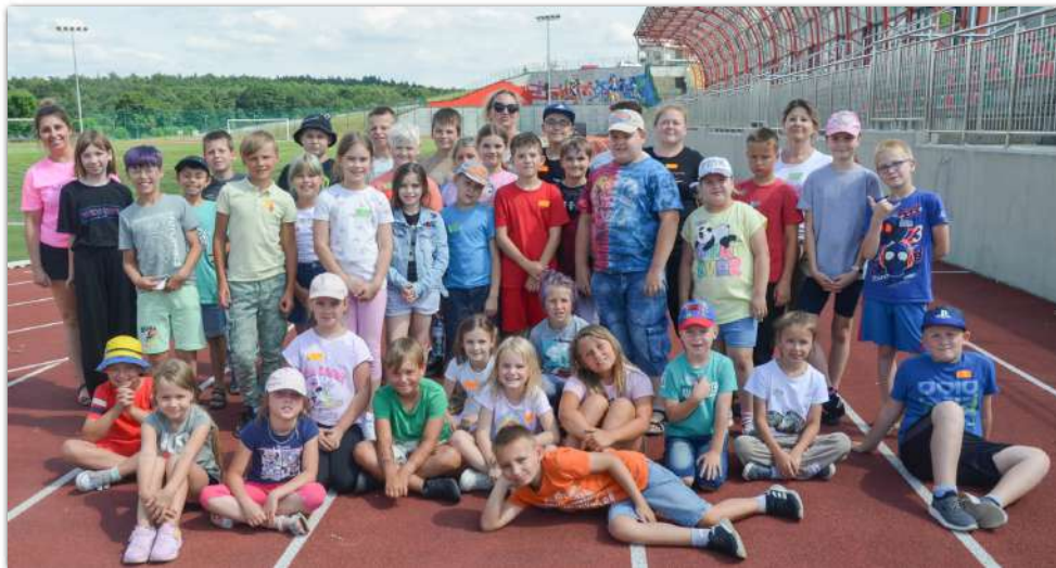
W półkoloniach (w dwóch turnusach) uczestniczyło ponad 70 młodych mieszkańców gminy Barcin

□ Ponad siedemdziesięciu młodych mieszkańców gminy Barcin w wieku od 7 do 11 lat wzięło udział w półkoloniach organizowanych przez gminę Barcin. Dzieciom zapewniono m.in. zajęcia rozwijające ich zdolności manualne, sportowe, edukacyjne czy artystyczne.