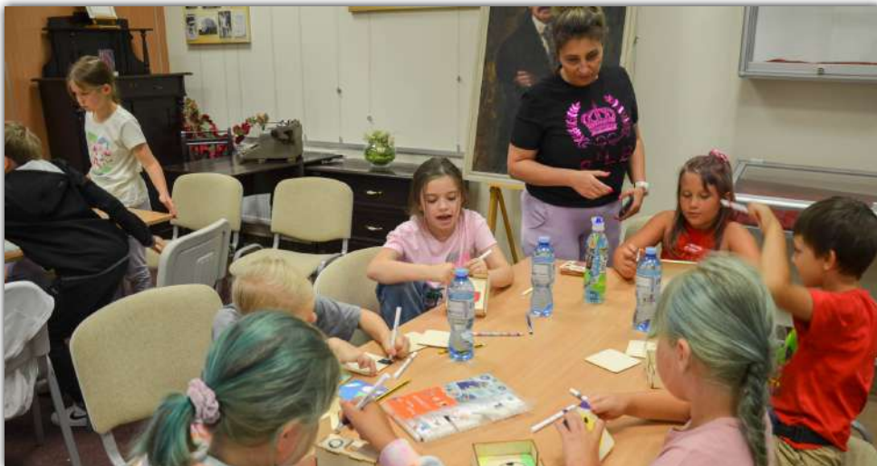
Chłopcy i dziewczęta wzięli udział w zajęciach edukacyjnych, manualnych, artystycznych, plastycznych, animacyjnych w Szkole Podstawowej nr 2, bibliotece i w MDK