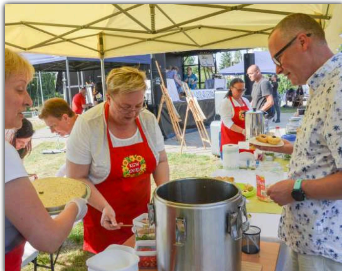
Panie z KGW Knieja częstowały przybyłych gości wyśmienitą zupą „Kniejówką”