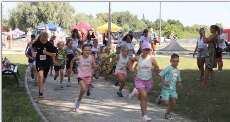
Festyn Miodowy rozpoczął bieg miodowy dla najmłodszych

□ W sobotę, 20 lipca, odbył się Festyn Miodowy, który był kulminacyjnym punktem tegorocznych Dni Miodu. Zabawa rozpoczęła już od wczesnych godzin przedpołudniowych, a akcentem otwierającym wydarzenie był miodowy bieg parkowymi alejkami dla najmłodszych mieszkańców naszej gminy.