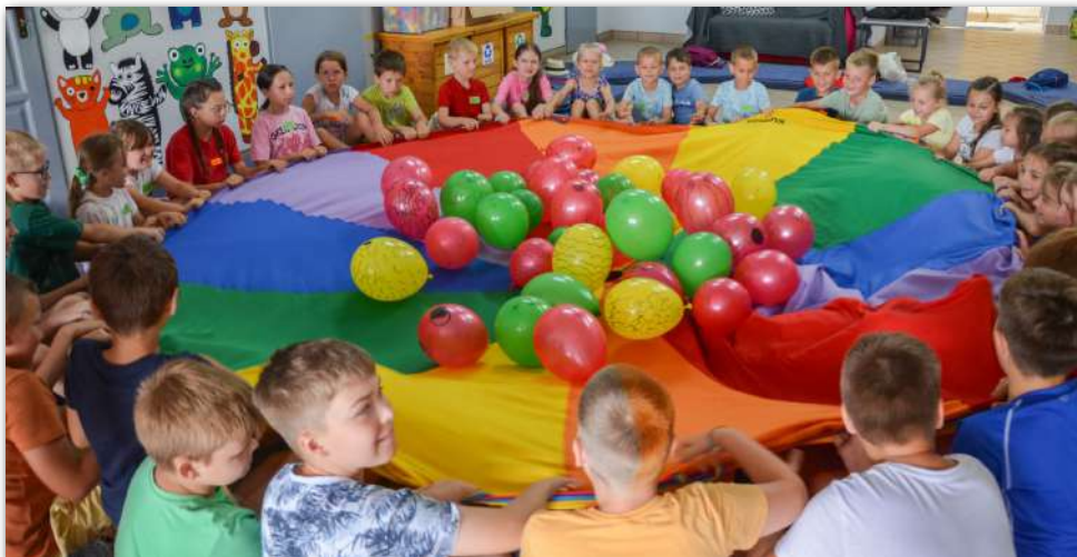
Dzieci uczestniczyły także w zajęciach profilaktycznych w Kolorowym Zakątku z chustą „Klanza”