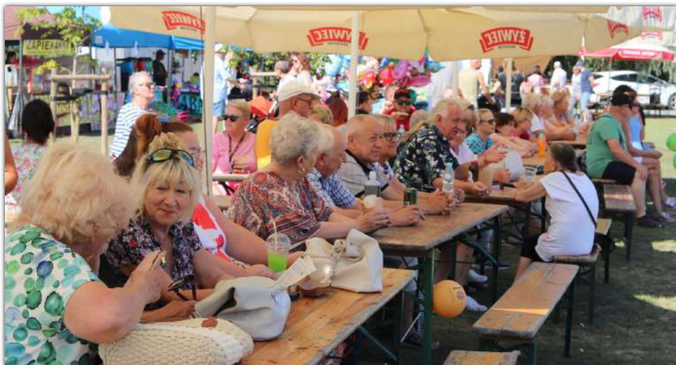
Po raz kolejny imprezę odwiedzili licznie przybyli mieszkańcy