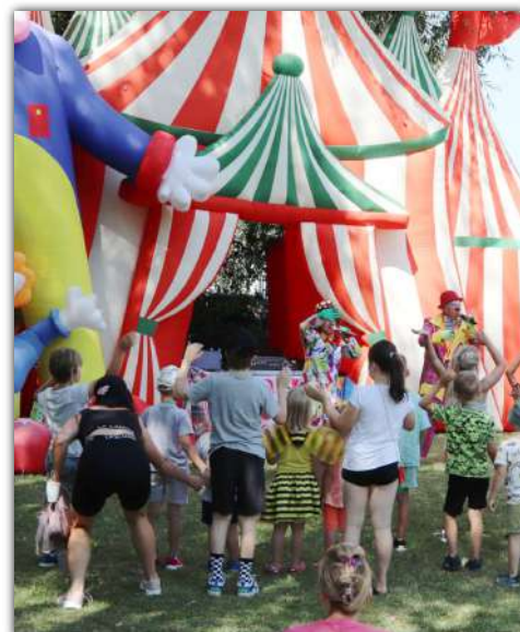
Po biegu miodowym dla dzieci zorganizowano zabawę z klaunami