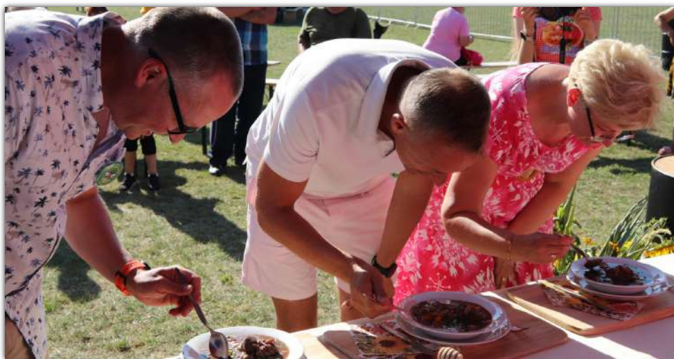
Potrawy przygotowane przez kgw oceniała trzyosobowa komisja konkursowa