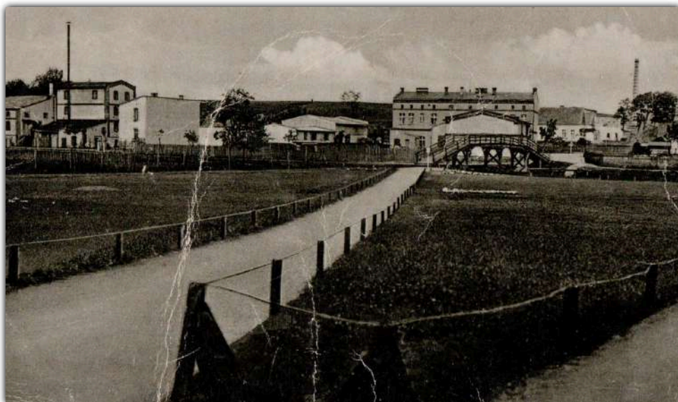
Widok na most tzw. garbaty przy ul. Wyzwolenia w czasie II wojny światowej