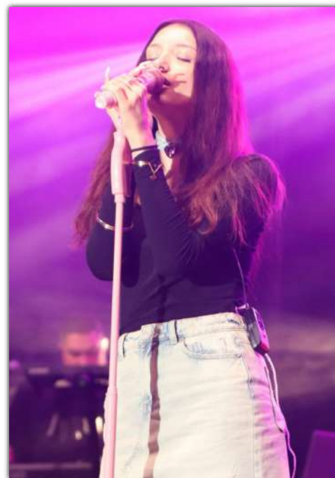
Gwiazdą festynu była Viki Gabor

rował zespół „Wokalni”. Następnie do wspólnej zabawy zaprosiły zespoły „All Dęte”, „Nowator” oraz „Cosmos. A gwiazdą tegorocznej sceny była Viki Gabor. Imprezie towarzyszyły oczywiście liczne stoiska z artykułami pszczelimi i pszczelarskimi oraz gastronomiczne, kosmetyczne czy rękodzielnicze. Była też strefa gastronomiczna. Dodajmy, tegoroczne Dni Miodu to nie tylko Festyn Miodowy – choć to właśnie on był głównym wydarzeniem słodkiego święta. W tym roku towarzyszyły mu: warsztaty plastyczne zrealizowane przez Bibliotekę Publiczną Miasta i Gminy Barcin, seans „Pszczółka Maja” w Kinie Baré i wycieczka