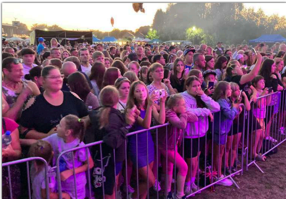
Zaplanowane tego dnia koncerty również przyciągnęły swoją publikę