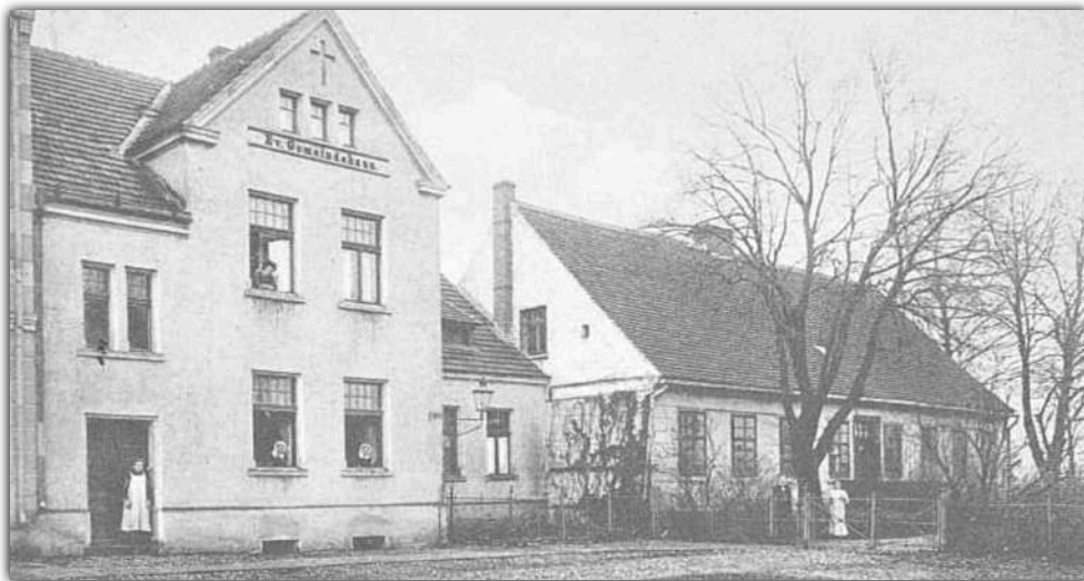
Budynki parafii ewangelickiej przy ul. Wyzwolenia w Barcinie - „pastorówka”, klasztor i sala parafialna

□ Pod koniec czerwca br. mieszkańcy miasta uczestniczyli w wydarzeniu zorganizowanym z inicjatywy Towarzystwa Miłośników Miasta i Gminy Barcin, czyli imprezie poświęconej historii jednej z najstarszych barcińskich ulic - ulicy Wyzwolenia. Z tej okazji zapraszamy na małą wycieczkę w przeszłość.