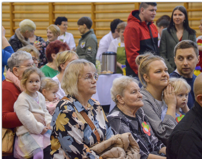
Wielkanocne wydarzenie zgromadziło sporą publiczność - od najmłodszych do najstarszych mieszkańców sołectwa Piechcin