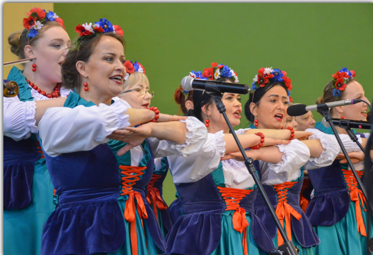
Na scenie w sali SP Piechcin zaprezentował się również zespół „Kwiaty Polskie”, który występował podczas Dni Miodu w Barcinie