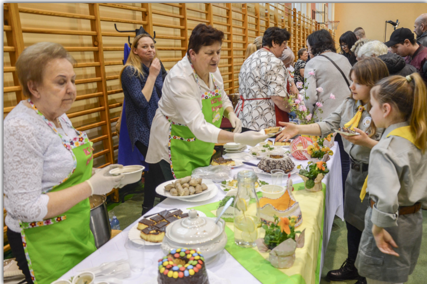
W ramach budżetu obywatelskiego przed Wielkanocą zorganizowano w Piechcinie świąteczny jarmark. Panie z gminnych KGW przygotowały pyszne jadlo