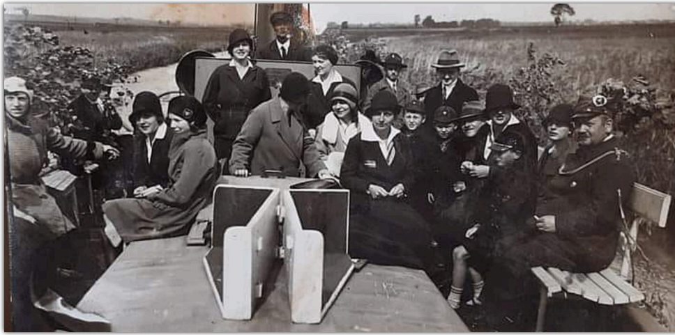
Rejs na Ostrówiec, międzywojnie.

Majówka to dni, na które czekają chyba wszyscy. Wolne od pracy i szkoły, wiosenna pogoda – nic, tylko korzystać. Niektórzy wypoczywają, inni planują wyjazd, kolejni korzystają z szeregu różnorodnych imprez. Wszystkim czytającym życzymy przyjemnej majówki, zapraszając jednocześnie na wycieczkę w przeszłość – opowieść o tym, jak w międzywojennym Barcinie spędzano pierwsze dni maja.