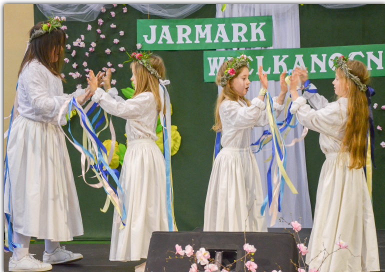
Podczas jarmarku wielkanocnego podziwialiśmy występy między innymi dzieci z sekcji działającej przy Miejskim Domu Kultury w Barcinie