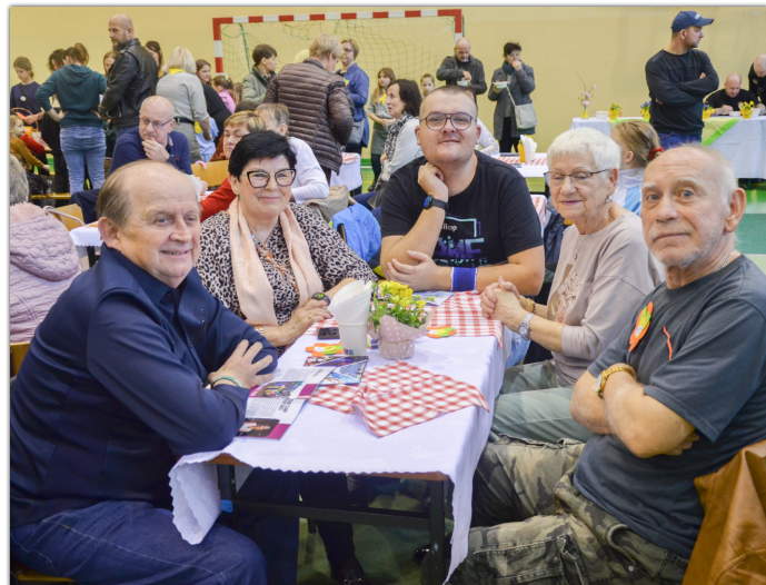
Podczas piechcińskiego jarmarku wielkanocnego wszystkim zgromadzonym dopisywały wyśmienite humory